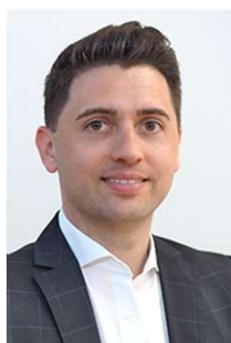
Präsident Simon Reuter