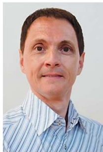
Vizepräsident André Waibel