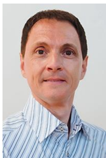
Vizepräsident André Waibel