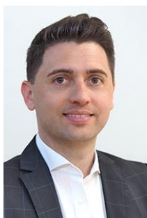
Präsident Simon Reuter